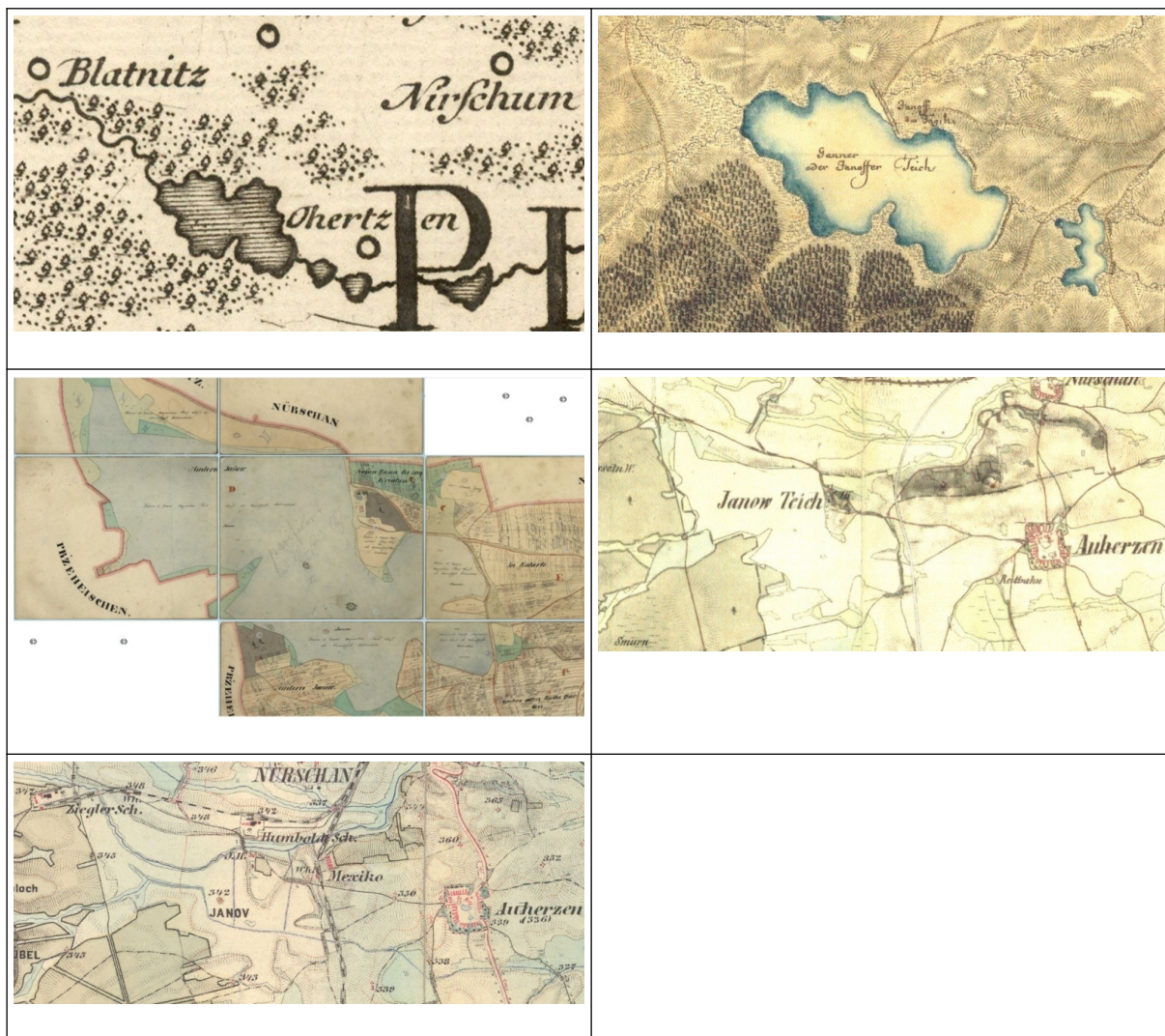
Obr. 1: zobrazení území s rybníkem na historických mapách: Müllerova mapa Čech (1720) - I. vojenské mapování (1764-68) – indikační skica stabilního katastru (1838) – II. vojenské mapování (1836-1852) – III. vojenské mapování (1877-1880), rybník již vypuštěn.