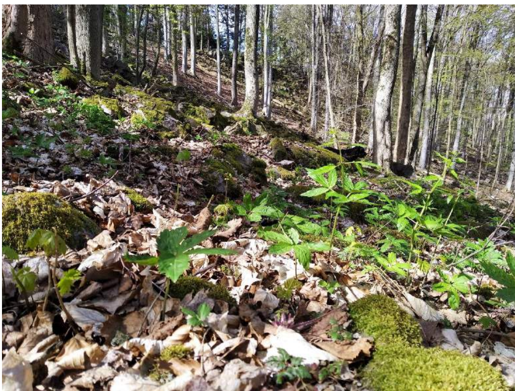
Foto 2: Malá populace Dentaria bulbifera na pomezí suťového lesa a bučiny pod hřebenem v dílčí ploše 124A17 (15. 4. 2020)