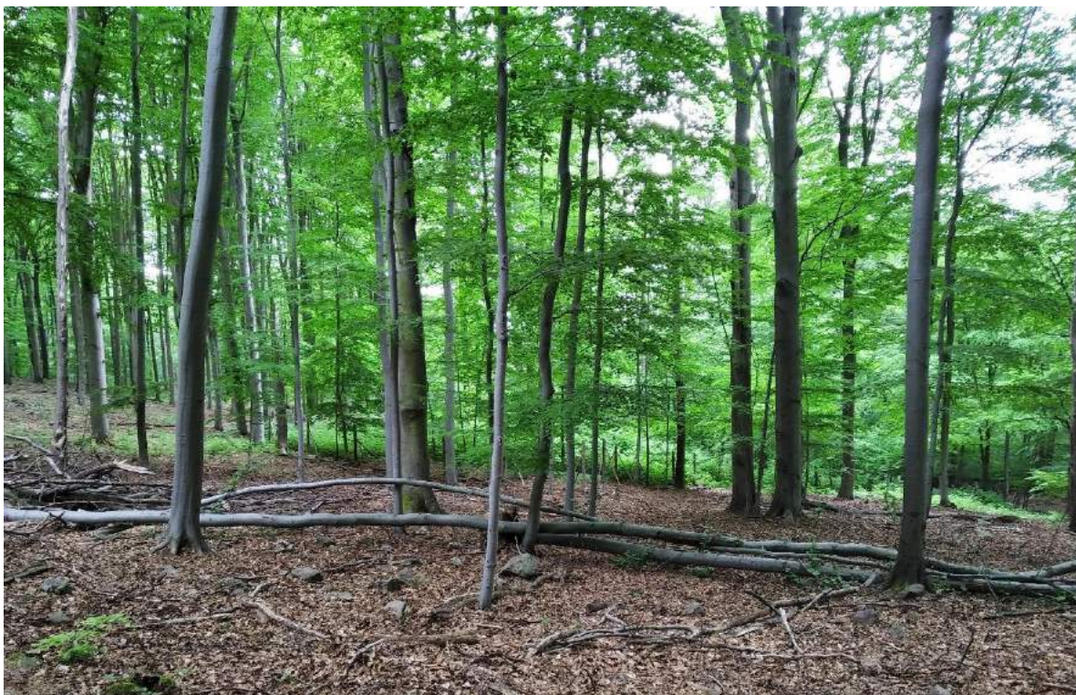
Foto 4: V bučině v dílčí ploše 123A17a/3/2a (20. 5. 2020)