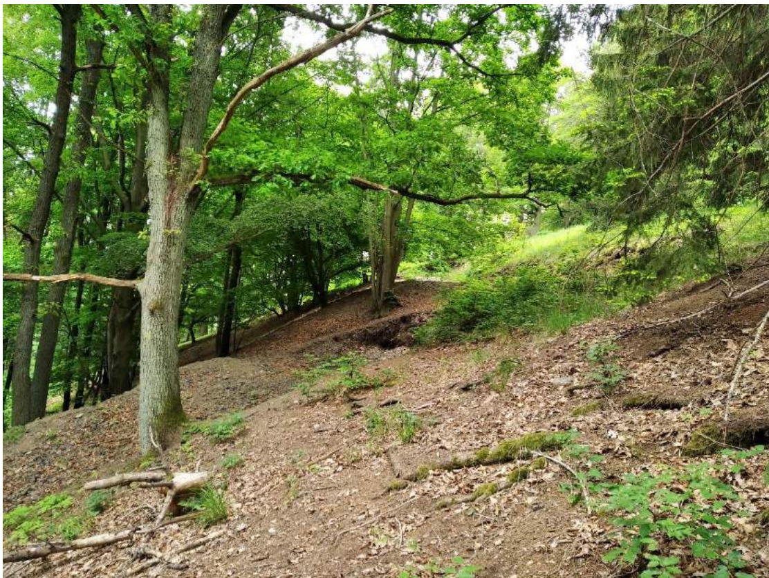
Foto 5: Paleontologická lokalita v dílčí ploše 5B102, pohled ze SV. Nad odkryvy je malé bezlesí se světlomilnějšími druhy (20. 5. 2020)