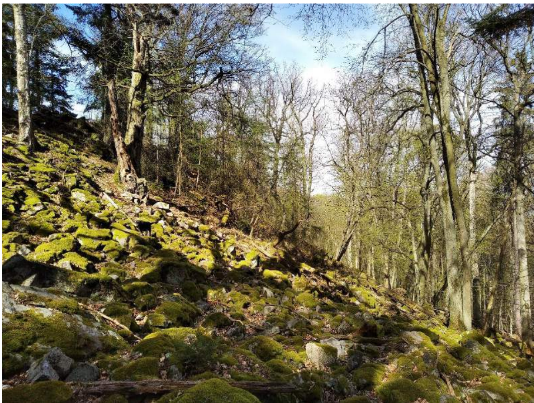
Foto1: V suťovém lese pod hřebenem se nachází velké množství mrtvého dřeva a vysoká pokryvnost mechového patra. Velikost balvanů je 50-100 cm, terén je velmi těžko schůdný (15. 4. 2020).