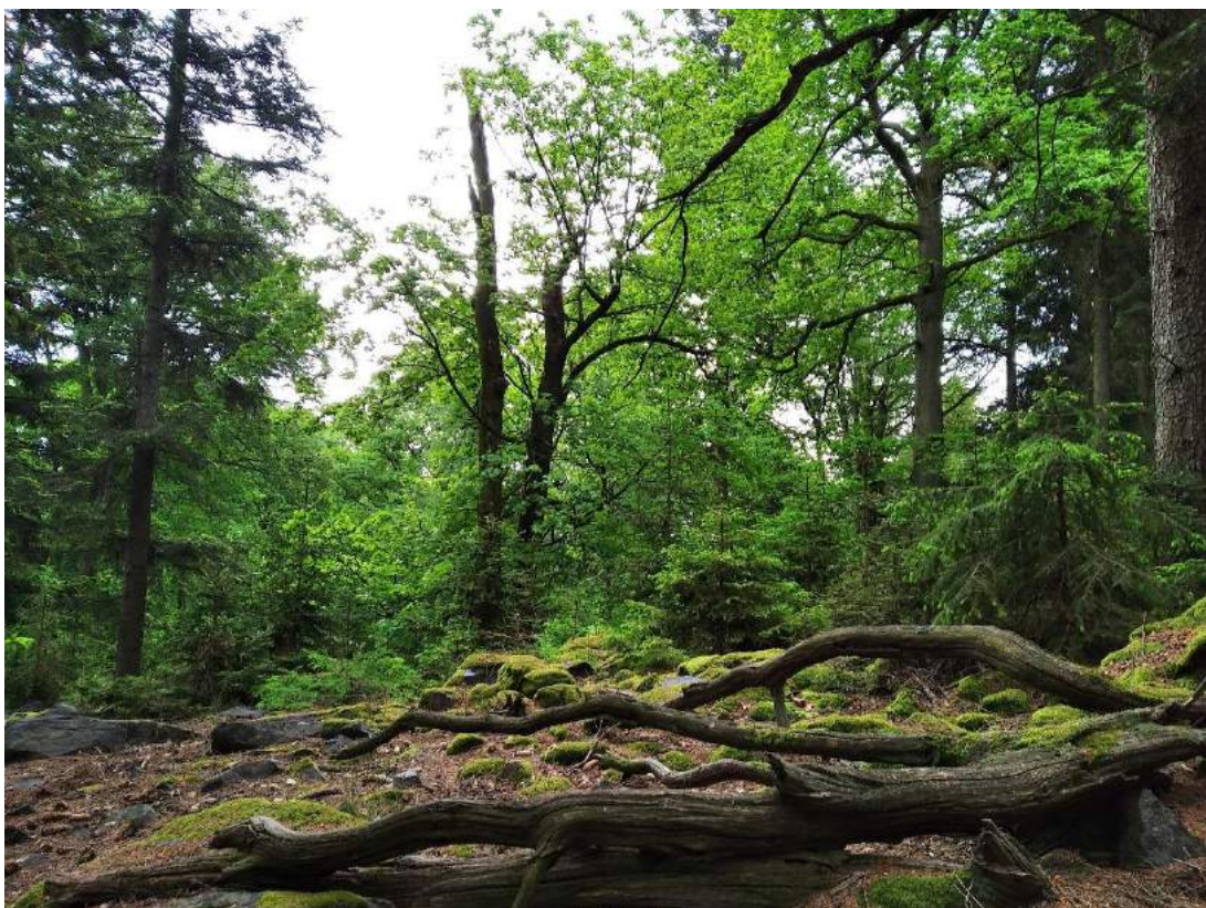
Foto 5: Hřebenová část na pomezí DP 125A17a a 125A17b s rozpadající se bučinou s vysokým podílem jedle